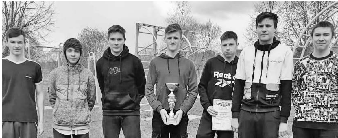
Команда-победитель из Чернышенской средней школы.

Ежегодно весной проходит молодежный спортивный праздник – День призвания. Его программа включает виды спорта, которые очень пригодятся во время службы в армии: это стрельба, бег на 100 и 2000 м, метание гранаты, прыжки с места и с разбега, подтягивание, разборка и сборка автомата.