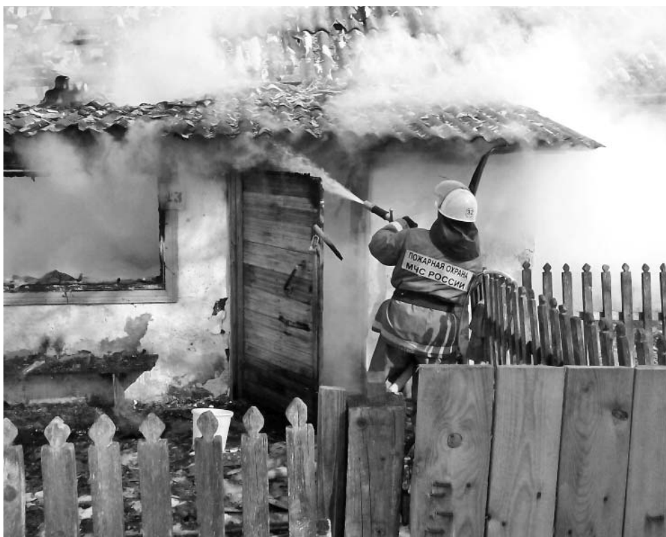
Борьба с огнем на пожаре в д.Поляки.